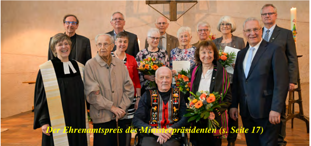
Der Ehrenamtspreis des Ministerpräsidenten (s. Seite 17)

Impressum Gemeindebrief „KONTAKT“, hg. von der Evang.-Luth. Johanneskirche Erlangen: C. R. Morath (Layout, Redaktion), M. Weiß, Dr. E. Gröschel, A. Jalowski (Redaktions-Team) - Druckauflage: 2000 Stück - Druckhaus Haspel, Willy-Grasser-Straße 13, 91056 Erlangen- ViSdP: Pfrin. Dr. Bianca Schnupp, Tel. 40 99 03 - bianca.schnupp@elkb.de Achtung: Redaktionsschluss für den Oktober-November-KONTAKT ist Montag, 19. August 2024! Der Oktober-November-KONTAKT ist zur Abholung bereit am 19. September 2024.